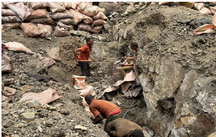
Miners extracting ore in an open-pit mine at the Shabara mining site, an artisanal mine that forms part of the Mutanda mining complex in the Democratic Republic of the Congo (DRC).

Volgens de Wereldbank is tussen de 10% en 30% van de mineralenproductie in de Democratische Republiek Congo afkomstig uit kleinschalige mijnbouw. Het rapport Global Trace: The Cobalt Supply Chain Mapping Report (2025) , gefinancierd door het Amerikaanse ministerie van Arbeid, schat dat bijna 35.000 kinderen werkzaam zijn in kleinschalige mijnen, op een totaal van ongeveer 255.000 mijnwerkers. Deze kinderen wassen, sorteren en winnen mineralen onder gevaarlijke omstandigheden, vaak ten koste van hun gezondheid, veiligheid en onderwijs.